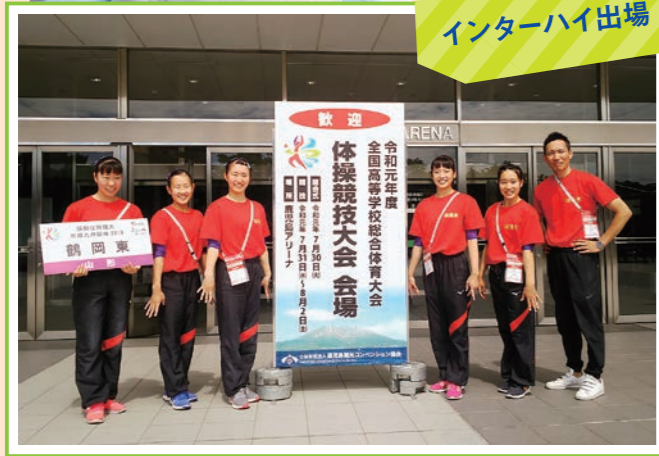
インターハイ出場

今年は決勝に出場し、ベスト16に入ることができました。仲間と声を出し合い、支え合い、楽しく演技ができました。来年の地元の酒田インターハイでは、団体入賞を目標に日々の練習を精一杯頑張っていきます。