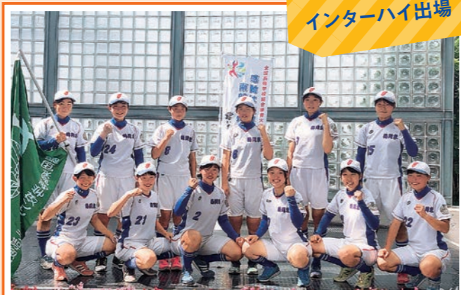
インターハイ出場

私たちは「東日本大会金賞」という目標を掲げこの1年間頑張ってきました。その成果もあり、東北大会金賞をいただく事ができました。東日本大会ではお世話になったすべての方に恩返しができる様に精一杯頑張ります。